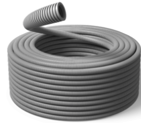
25 mm Speed 750N / R100