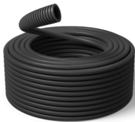
32 mm Speed HF UV 750N / R25