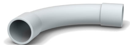
Bochten CUGHF 20 mm