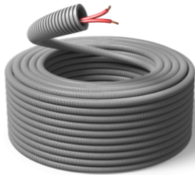
20 mm / FS17 2x1,5 RR / R100