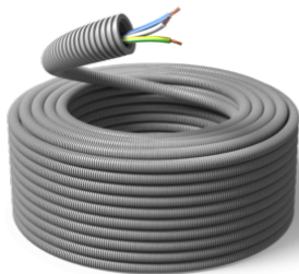
16 mm / FS17 3G1,5 BTW / R100