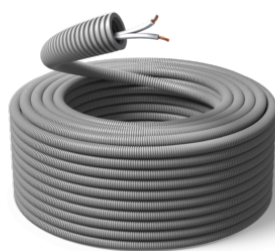
16 mm / FS17 2x1,5 WW / R100