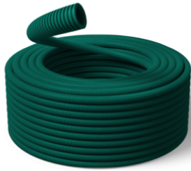
32 mm Speed ECO GREEN 750N / R50