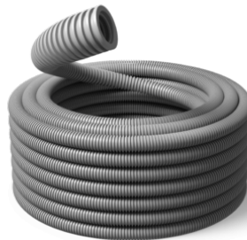
63 mm Speed 750N / R25