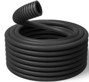
50 mm Speed HF UV 750N / R25