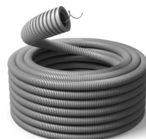
63 mm Speed F 750N / R25